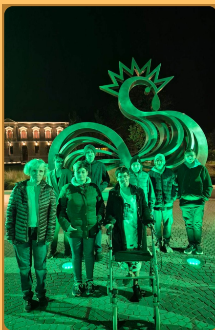
I MI SMO PICOKI