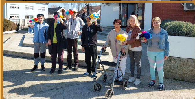
PODJELA RUŽA POVODM DANA ŽENA