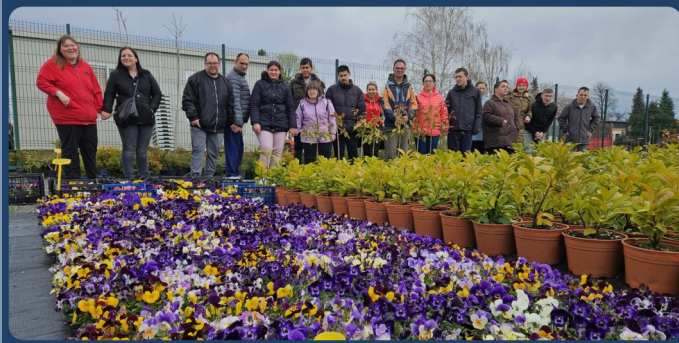
RASADNIK KOMUNALNIH USLUGA ĐURĐEVAC