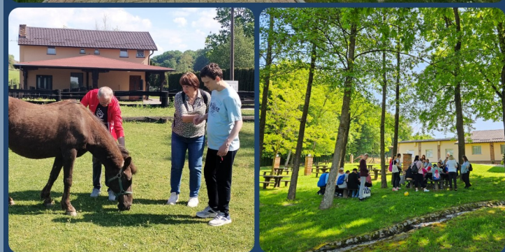
OBITELJSKO IZLETIŠTE NOVAK 30. TRAVNJA 2025.

Koji se elementi uzimaju u obzir pri planiranju aktivnosti za članove poludnevnog boravka?