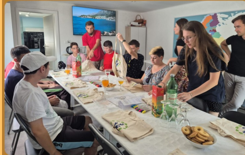
S ČLANOVIMA UDRUGE SUMA