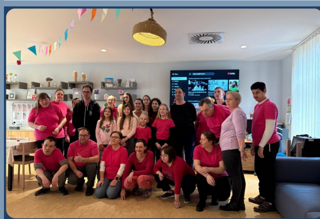
DAN RUŽIČASTIH MAJICA 26. VELJAČE S OSNOVNOM ŠKOLOM KALINOVAC

Obilježavanje važnih datuma idealan je način da se na iskustven i zabavan način nauči novo ili se pak podsjeti na ono već usvojeno, no smetnuto s uma. U tu svrhu važne datume obilježavamo uvijek u suradnji s pripadajućim stručnjacima, udrugama, školama i prijateljima. Svrha je takvih aktivnosti uspješnije, lakše, brže i učinkovitije učenje. Sretni smo što pri tome uvijek nailazimo na samo nasmiješena lica spremna za suradnju i prenošenje znanja našim članovima. Hvala svima koji svoja znanja dijele s nama, naša su Vam vrata uvijek otvorena!