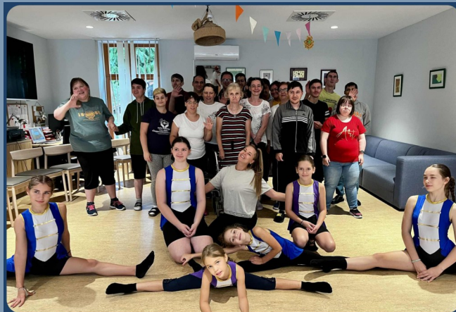
SVJETSKI DAN TJELESNE AKTIVNOSTI 10. SVIBNJA SA ŠKOLOM CIRKUSA RAY OF SUNSHINE