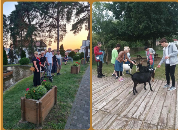
ŠETNJA GRADOM BLAGDAN VELIKE GOSPE NA MOLVAMA HRVATSKA SAHARA