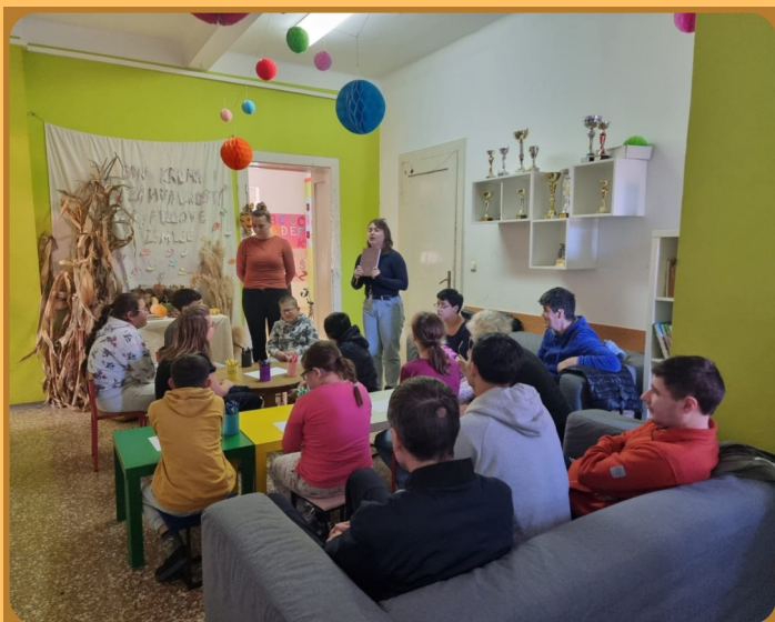
SVJETSKI DAN ROMSKOG JEZIKA

Veselim korakom te spretnih ruku članovi organiziranog stanovanja sudjeluju u lokalnoj zajednici, ali i zasluženo uzimaju trenutke predaha. Bezbroj bismo riječi mogli iskoristiti za njihove raznolike aktivnosti, no i niz fotografija govori mnogo.