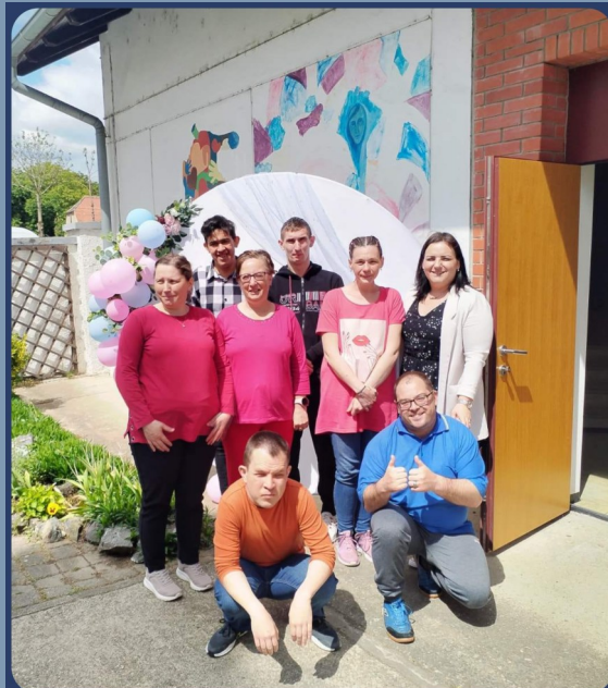
DRUŽENJE UDRUGA KOD MASLAČAKA