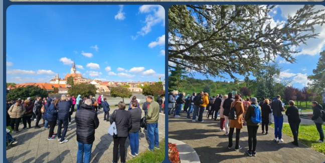
MARIJA BISTRICA 3. LISTOPADA 2025.