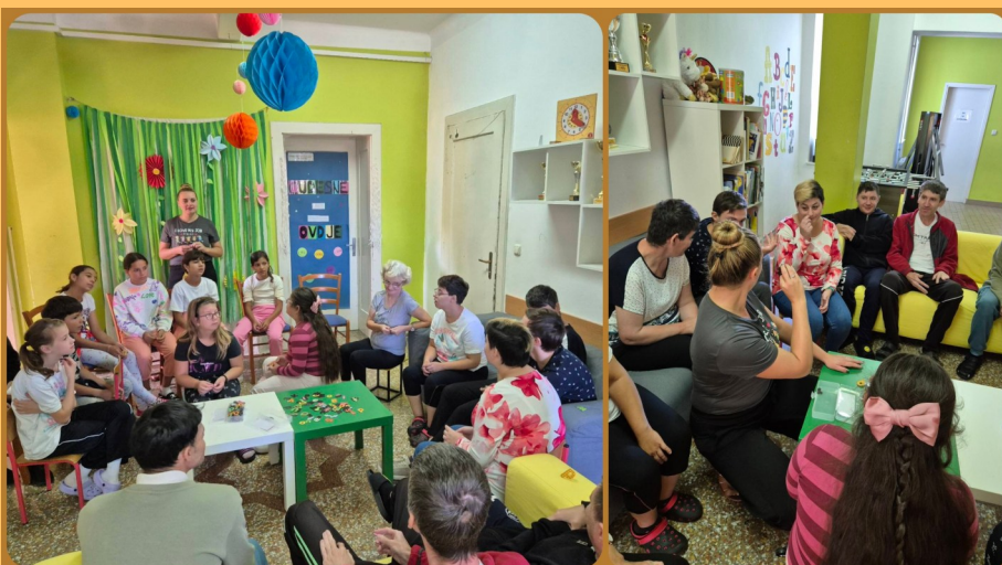
MEĐUNARODNI DAN PISMENOSTI S ODJELOM ZA DJECU S TEŠKOĆAMA U RAZVOJU OŠ ĐURĐEVAC