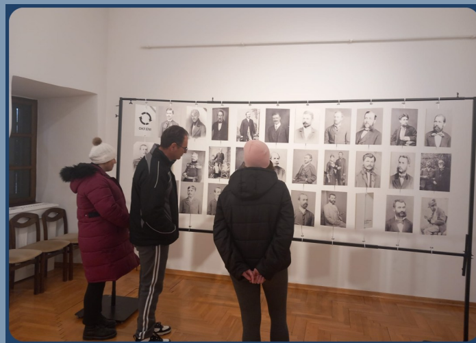
MUZEJ GRADA ĐURĐEVCA

Članovi su poludnevnoga boravka prepoznati sudionici zajednice. U prilog tome govori činjenica da brojne lokalne institucije i udruge rado ugošćuju družinu poludnevnog boravka, uključuju ih u svoje aktivnosti te im još veselije uzvraćaju posjet. Sa sezonskom ponudom cvijeća u Rasadniku komunalnih usluga grada Đurđevca naši su članovi uvijek upoznati. Gotovo na mjesечноj bazi provodi se i međusobna suradnja te posjećivanje s prijateljima iz Strukovne škole Đurđevac, a posebno kada su u pitanju manifestacije poput Dana otvorenih vrata udruga. Muzej grada Đurđevca i Gradska knjižnica Đurđevac uvijek su divno mjesto za posjetiti i uvrstiti ih u tjedne planove. Lokalne udruge, poput Udruga žena grada Đurđevca, izvor su tradicijskog znanja o vlastitome zavičaju.