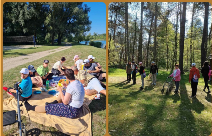
IZLET NA KALNIK PIKNIK NA JEZERU ČINGI-LINGI AKCIJA ČIŠĆENJA BORIKA