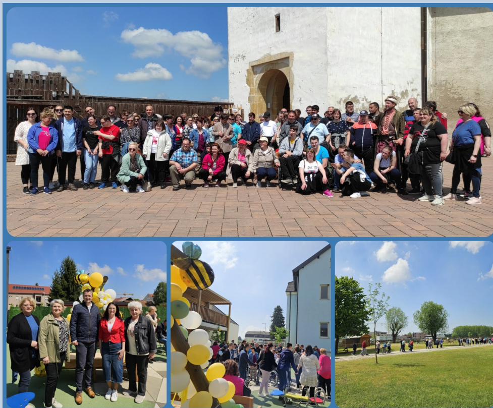
STARI GRAD, DVORIŠNI PROSTOR UDRUGE I ZOOLOŠKI VRT