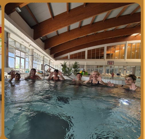
KUGLANJE, PRIPREMA OBROKA, PROSLAVE ROĐENDANA, BAZENI