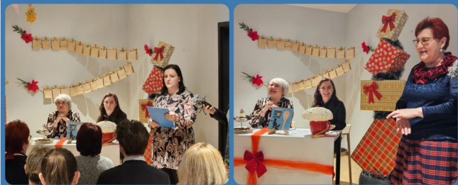
PROMOCIJA KUHAČE MALOG PRINCA 3.12.2024.