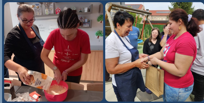
UDRUGA ŽENA GRADA ĐURĐEVCA