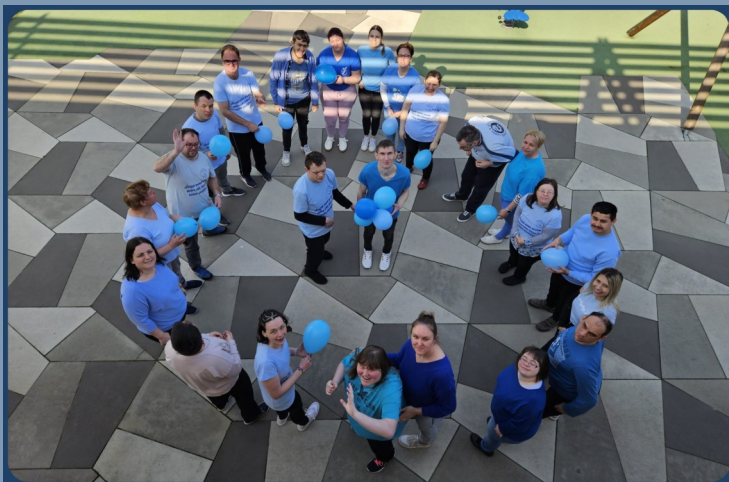
SVJETSKI DAN SVJESNOSTI O AUTIZMU 2. TRAVNJA