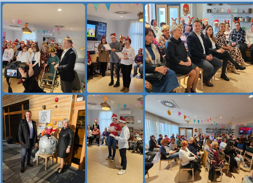
PROSLAVA DRUGE GODIŠNJICE USELJENJA U KUĆU PODRŠKE MALI PRINC I PODJELA NOVOG BROJA ČASOPISA UDRUGE