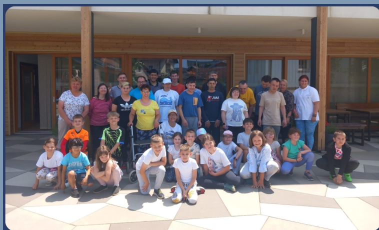
PRODUŽENI BORAVAK 2.A RAZREDA OŠ ĐURĐEVAC KOD NAS