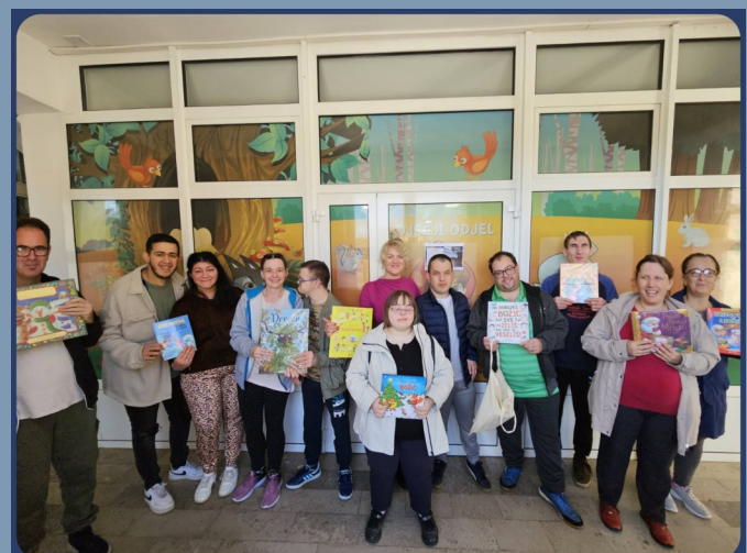
GRADSKA KNJIŽNICA ĐURĐEVAC