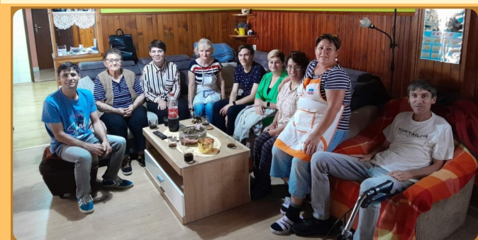
DRUŽENJE KOD ASISTENCE JASNE