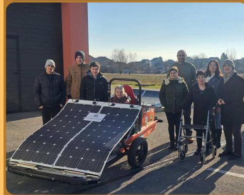
KULINARSKA RADIONICA U STRUKOVNOJ ŠKOLI ĐURĐEVAC i MEĐUNARODNI DAN VOZAČA I AUTOMEHANIČARA