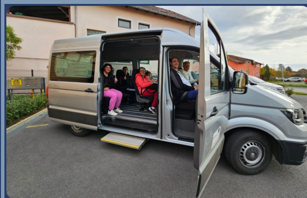
USLUGA ORGANIZIRANOG PRIJEVOZA U MALI PRINC