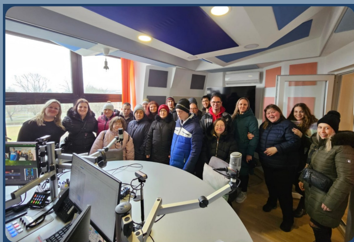
SVJETSKI DAN RADIJA 13. VELJAČE NA PODRAVSKOME RADIJU