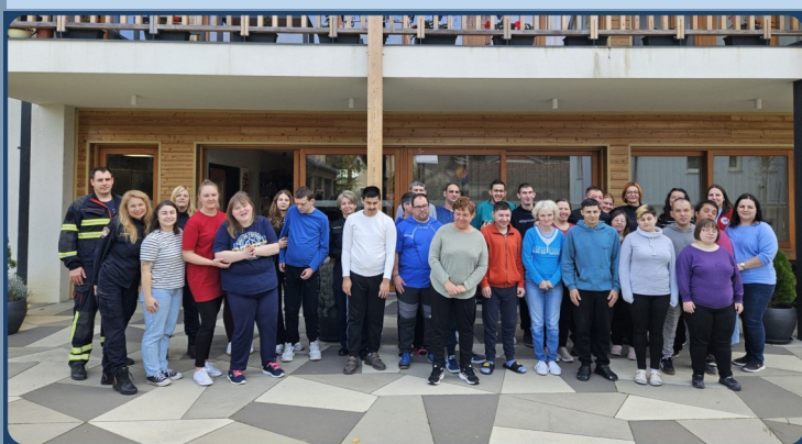
MEĐUNARODNI DAN SMANJENJA RIZIKA OD KATASTROFA 13. LISTOPADA S ČLANOVIMA HITNIH SLUŽBI