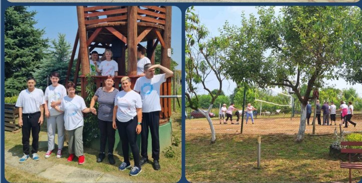
OPG KOVAČIĆ 11. LIPNJA 2025.