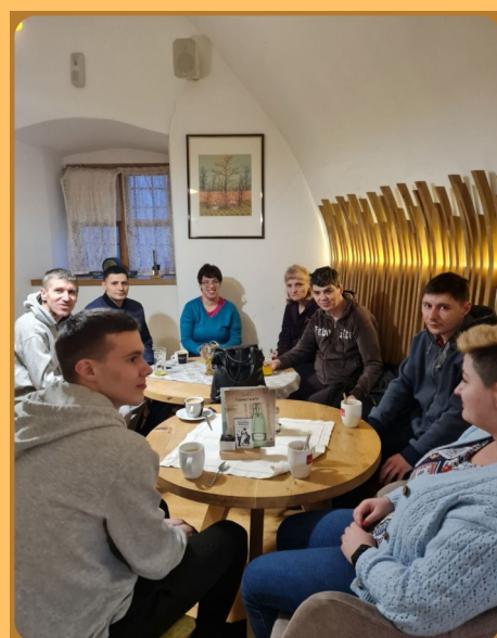
KAVA I OPUŠTANJE