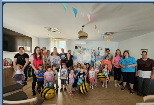
MEĐUNARODNI DAN PRIJATELJSTVA 30. SRPNJA S ODGOJNOM SKUPINOM KIKIČI DJEČJEG VRTIČA MASLAČAK