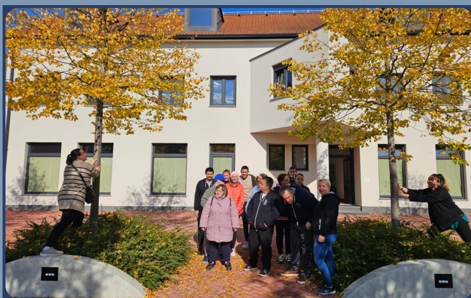
TIHO, O TIHO GOVORI NAM JESEN NA GRADSKOME TRGU