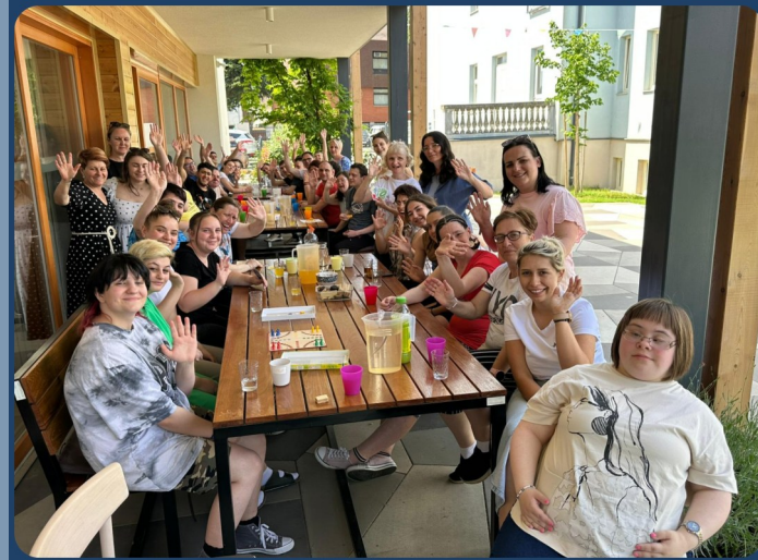
STRUKOVNA ŠKOLA ĐURĐEVAC